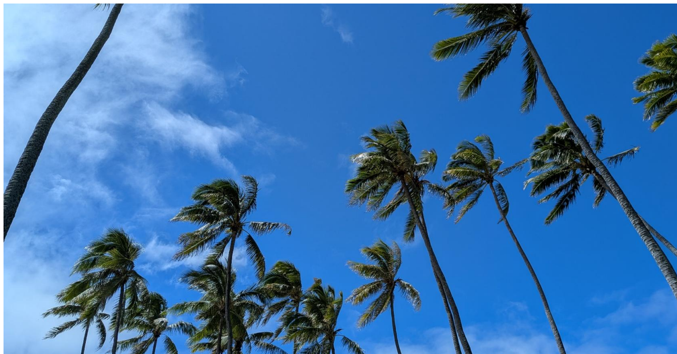
オアフ島カイルア地方